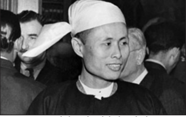
ဖဆပလကို ဦးဆောင်သူ ဗိုလ်ချုပ်အောင်ဆန်း

တိုင်းပြည်ပြုလွှတ်တော်ရွေးကောက်ပွဲကို ဇူလိုင်လ ၂၅ ရက်နေ့တွင် ကျင်းပခဲ့ရာ၌ ဖဆပလအဖွဲ့ချုပ်က လွှတ်တော်အမတ် ၅၅ ဦး ရရှိပြီး ဇူလိုင်လ ၂၅ ရက်နေ့တွင် အပြတ်အသတ်အနိုင်ရရှိခဲ့သည်။ ဖဆပလအဖွဲ့ချုပ်သည် ပထမအကြိမ်တိုင်းပြည်ပြုလွှတ်တော်ညီလာခံကို ၁၀ ဇွန် ၁၉၄၇ တွင် ခေါ်ယူထားရာ အခြေခံဥပဒေရေးဆွဲရေးအတွက် ပထမအဆင့်အနေဖြင့် ဖဆပလပဏာမညီလာခံကို ဦးစွာကျင်းပခဲ့ကြခြင်းဖြစ်သည်။