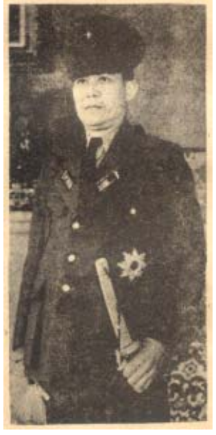
စစ်တပ်ဖြင့် တွေ့ရှိရသော ဒေါက်တာဘမော်